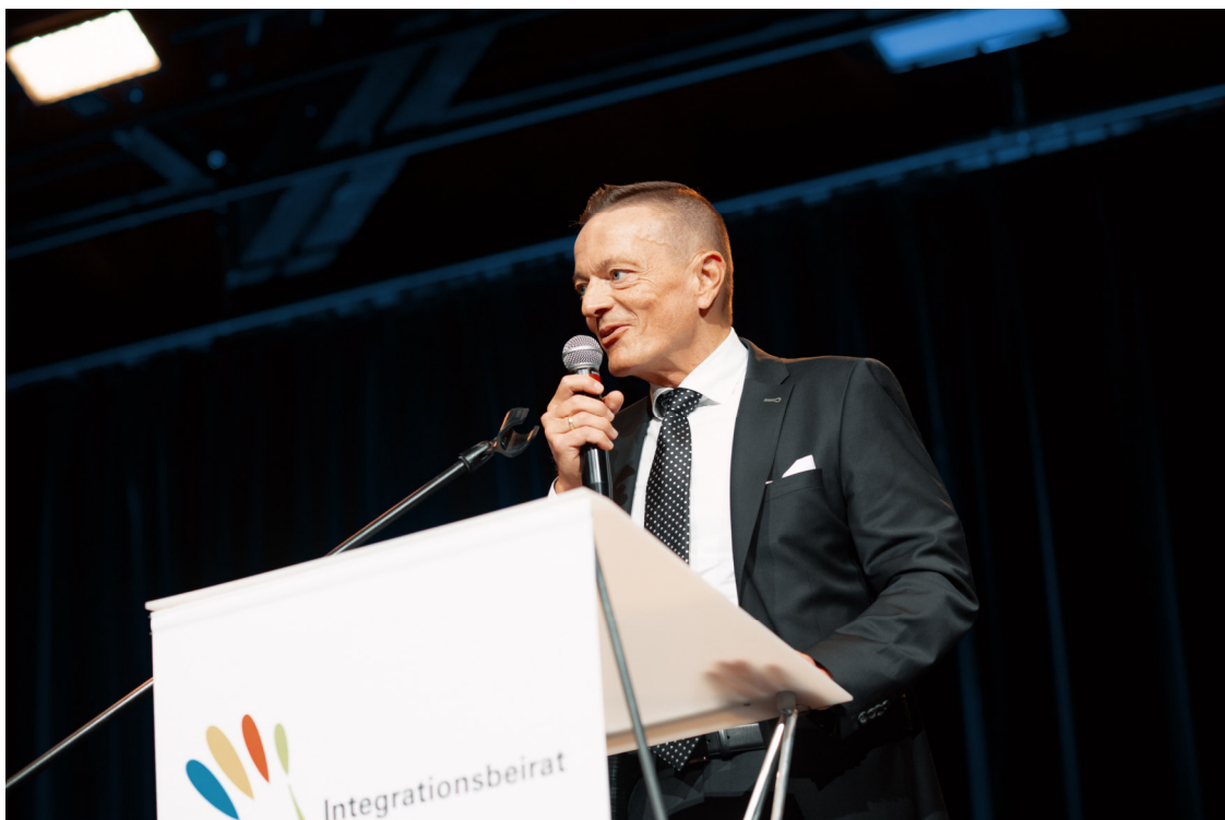
Karl Straub, Integrationsbeauftragter der Bayerischen Staatsregierung