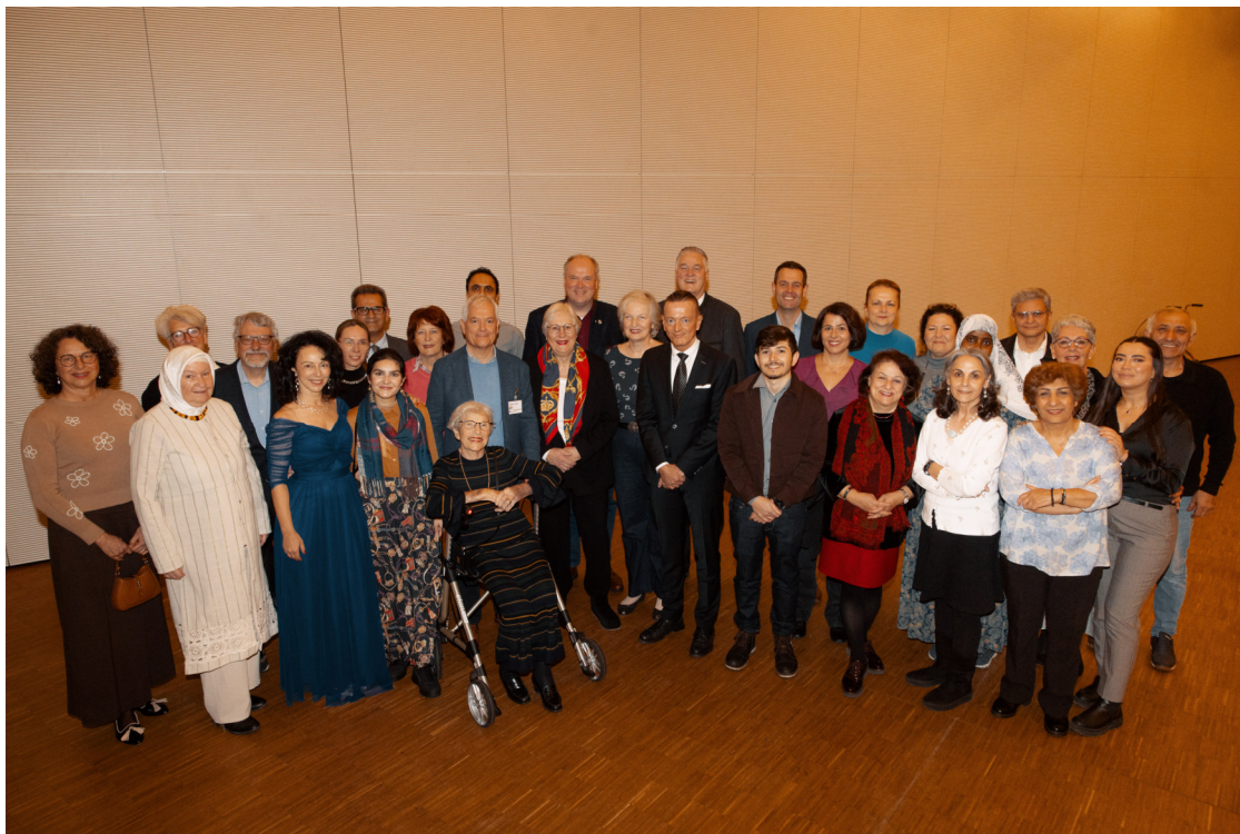
Aktuelle und ehemalige Mitglieder des Integrationsbeirats Garching mit den Ehrengästen