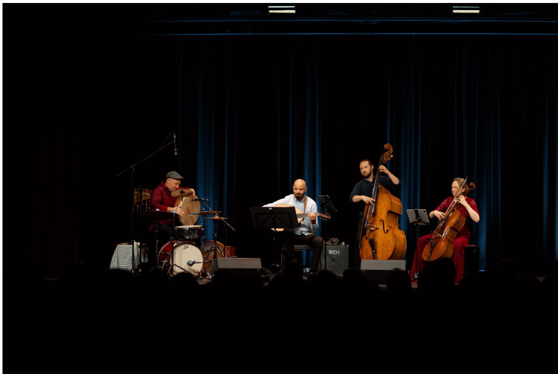
Met in Munich