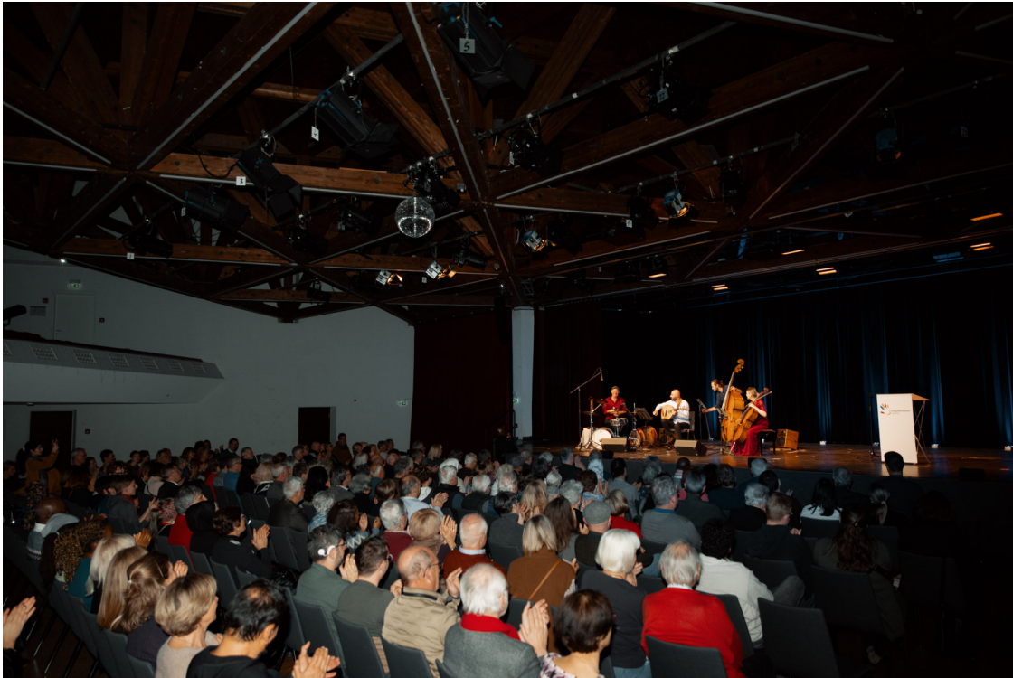
Ein voller Bürgersaal