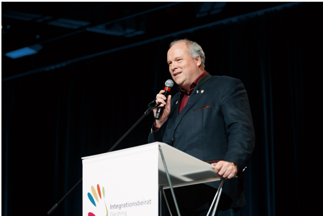
Christoph Göbel, Landrat des Landkreises München