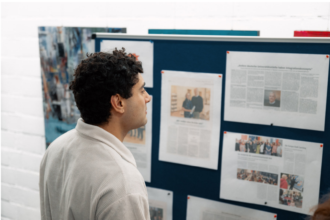
... und liest die Presseartikel über die Aktivitäten des Integrationsbeirats