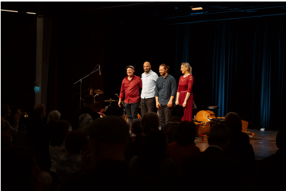
Abschließende „Standing Ovation“ für Met in München